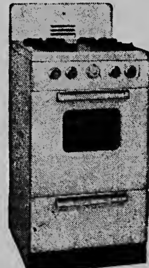
Model 6755A - f 290, —